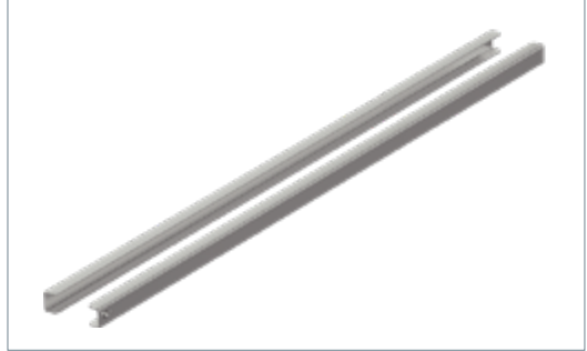
Guides for shelf, set of two pieces Οδηγοί για σχάρα, σετ των δύο τεμαχίων